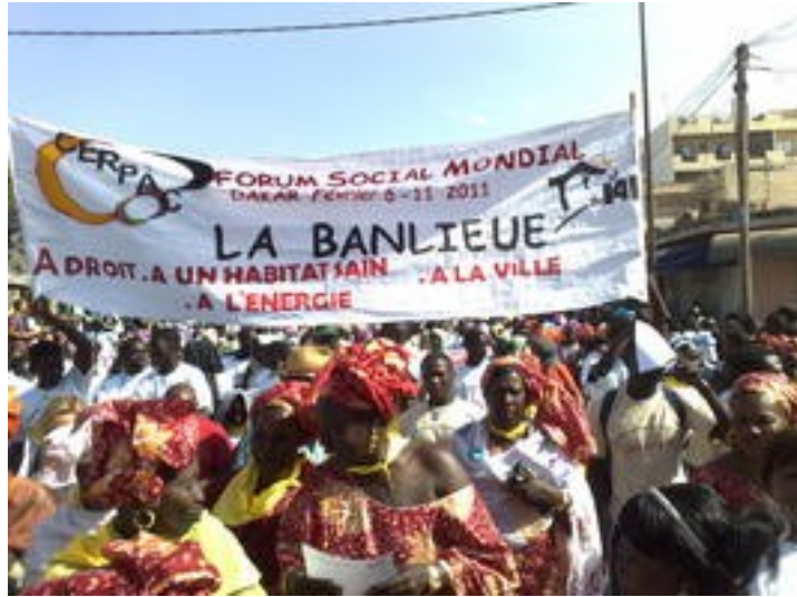
De los barrios populares de Dakar a la Asamblea Mundial de Habitantes 2011