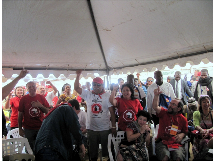
Aprobación de la Declaración de Dakar en el "Village des habitants"

La Asamblea se realizó con una serie de iniciativas, algunas auto-gestionadas por las distintas redes y organizaciones de habitantes, otras en colaboración (talleres y reuniones temáticas) con diferentes redes que querían aportar sus temáticas al proceso AMH y otras incluían a todos los participantes (la marcha de apertura, la sesión plenaria)