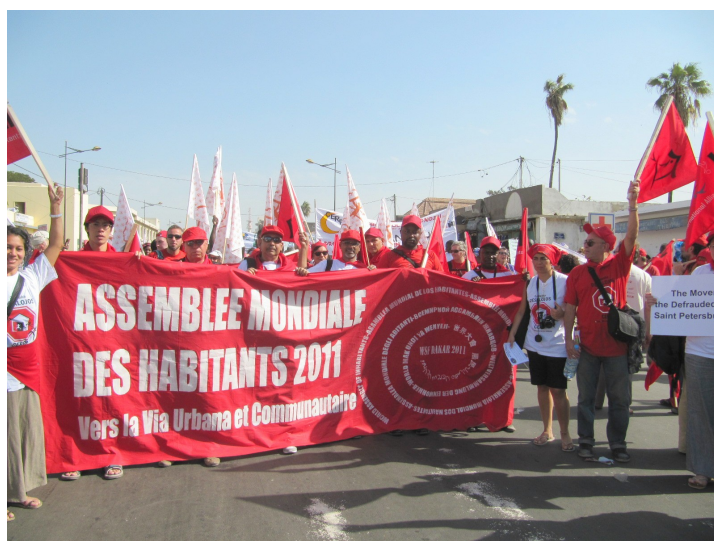
Los habitantes en la marcha de apertura del FSM Dakar 2011