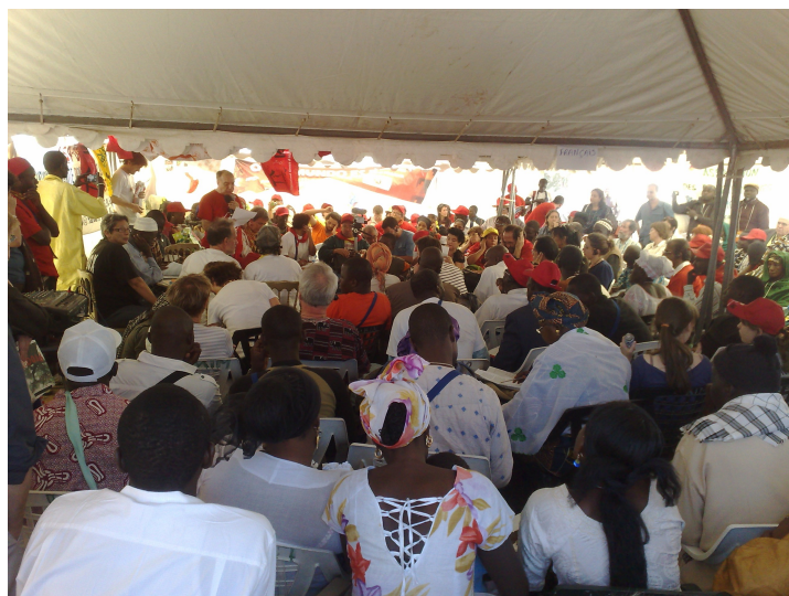
Lectura de la declaración de Dakar en el "Village des Habitants"