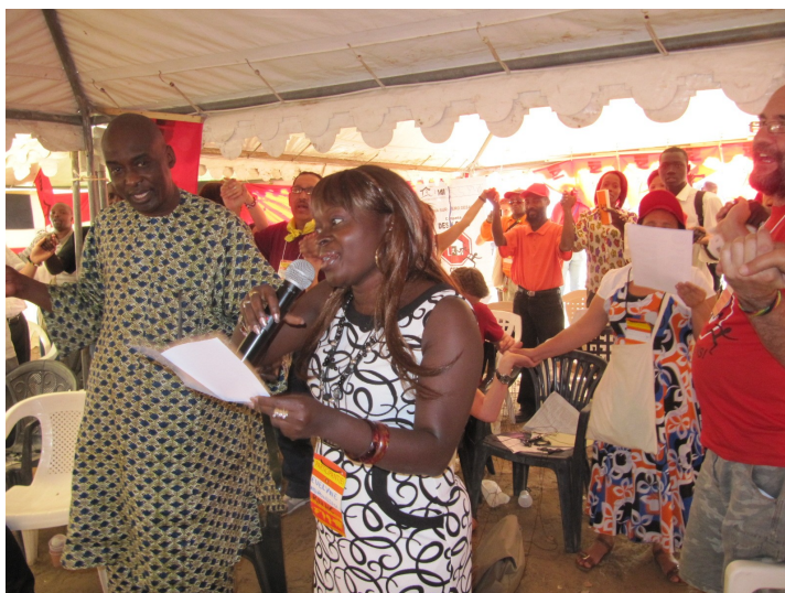
Cantando el himno de los habitantes (AMH, Dakar 10 Febrero 2011)