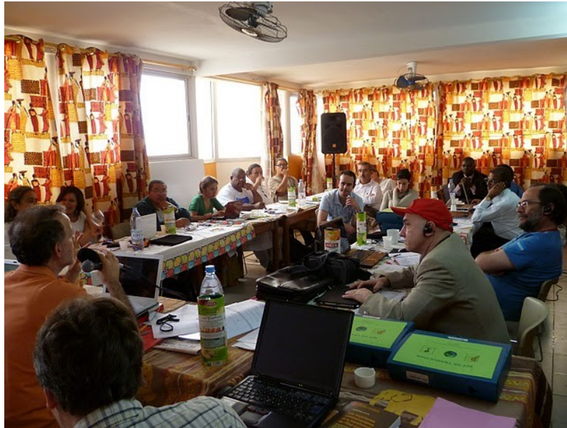
Reunión del Comité de Coordinación (AMH, Dakar Febrero 2011)

Desde su nacimiento, la Carta de los Principios fundadores ha sido siempre el motor, invisible pero poderoso, de la AIH, nuevo tipo de red en construcción, ser viviente colectivo que se desarrolla a medida que sus miembros toman consciencia de su fuerza en tanto g-locales.