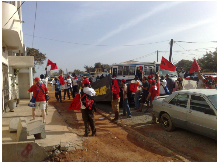
Manifestación frente a la Embajada de Ghana contra los desalojos Dakar 8 de febrero de 2011